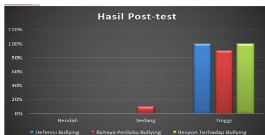
Table 2. Tabel Post-Test.

Hasil Post-test yang dilakukan oleh siswa SMP Muhammadiyah 1 Kota Ternate