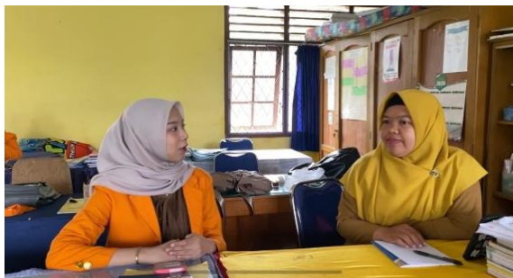
Gambar 2. Wawancara Kepala Sekolah

Berikut dilampirkan dokumentasi selama melaksanakan penelitian ini. Dokumentasi ini memperlihatkan foto saat dilaksanakannya proses wawancara bersama kepala sekolah dan guru. Materi pengajaran yang disertai oleh program literasi dan numerasi juga dilampirkan dalam bagian ini, beberapa di antara lainnya juga terdapat lampiran pembelajaran di kelas, hal ini memberikan pandangan yang jelas tentang proses pembelajaran dan pelaksanaan serta kerja sama antara guru dan kepala sekolah.