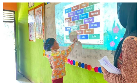
Gambar 5. Sumber Belajar