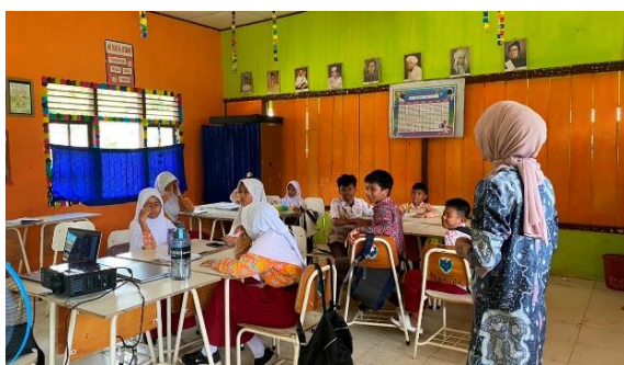
Gambar 4. Proses Pembelajaran