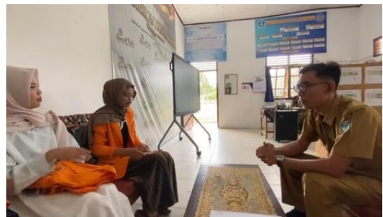
Gambar 3. Wawancara Guru